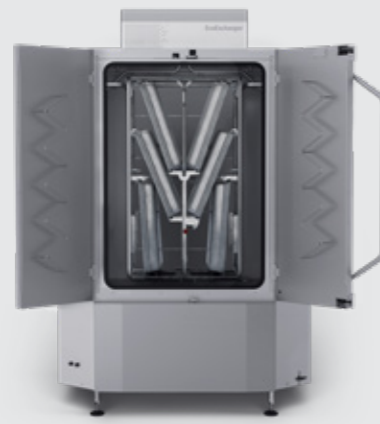
Granule Maxi® Pro

Kontakta en Nor.disk representant för en utvärdering, av dina behov och möjligheter.