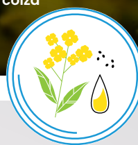
Huile de colza