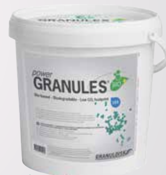
Assortiment 10 litres Réf. 26602

PowerGranules BIO usées sont recyclées comme des déchets combustibles. L'emballage est fabriqué à 40 % à partir de matériaux recyclés (polypropylène) et peut être recyclé avec les déchets plastiques.