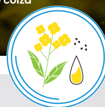
Huile de colza